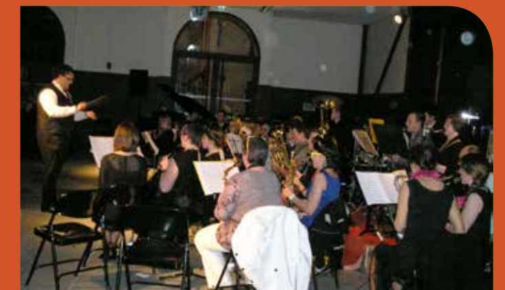
Le plein de vibrations au coeur de l'harmonie

En attendant, l'Harmonie Garlinoise qui prolongeait sa saison avec la novillada dans les arènes de la Porte du Béarn, la poursuivra avec la course landaise avant d'enchaîner les différents contrats de l'été festif.